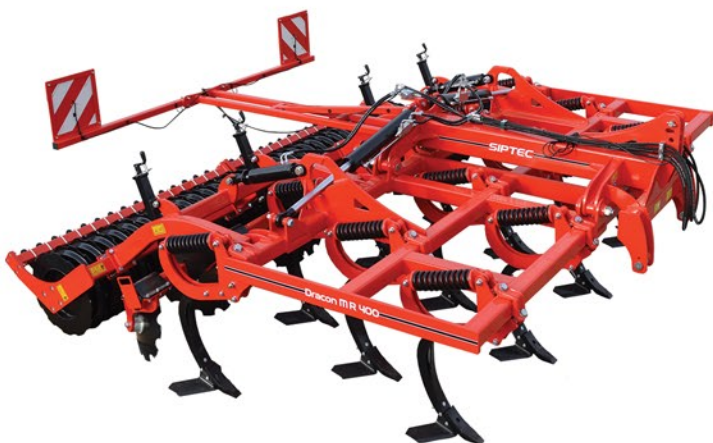
Dracon MR 400