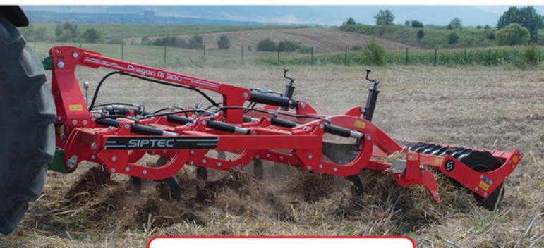
Dracon M HD 300