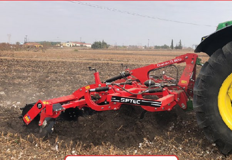
Dracon M² HD 300 [2 rows]